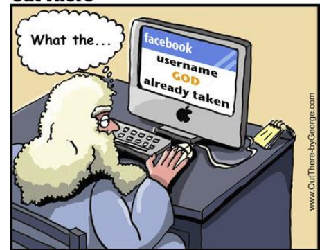
God on facebook